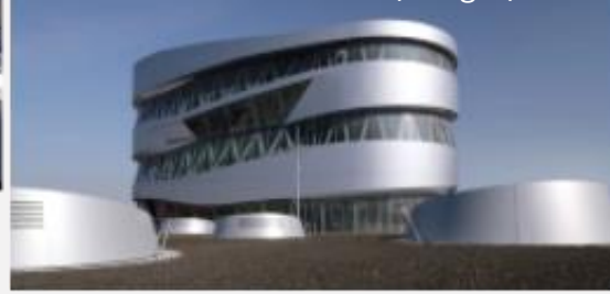
Visita museu da Mercedes (Stuttgart).

Conheça 130 anos de evolução das Tecnologias Automotivas. Uma experiência única para quem tem paixão por automóveis.