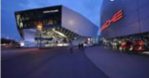
Visita museu da Porsche (Stuttgart).